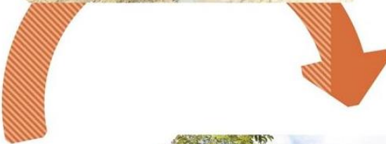
3 Demain, un espace naturel ouvert à la promenade