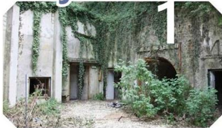
1 Aujourd'hui, une friche industrielle