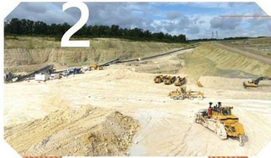
2 Exploitation du gypse et reconversion du site